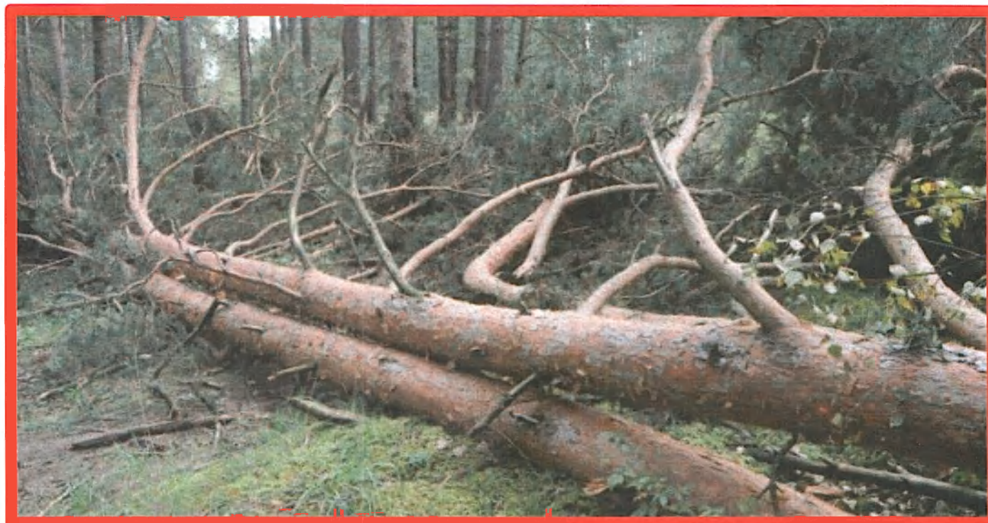
Лежащее на поверхности земли ветровальное дерево, не имеющее признаков отмирания. Не является валежником

Кроме того, необходимо обратить внимание, что деревья, которые лежат на земле, но не имеют признаков естественного отмирания (имеют зеленую листву или хвою), определять как «мертвые» не допускается (смотри изображение № 5).