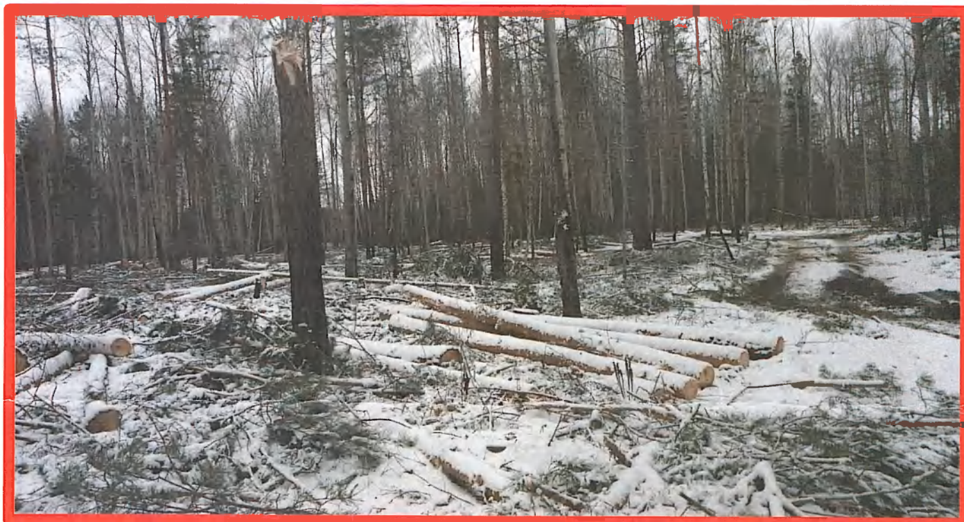
Изображение № 7 Брошенная древесина вдоль лесовозных дорог. Не является валежником