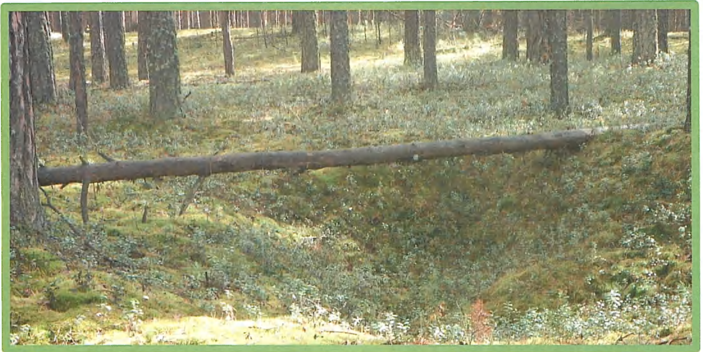
Изображение № 3 Валежник