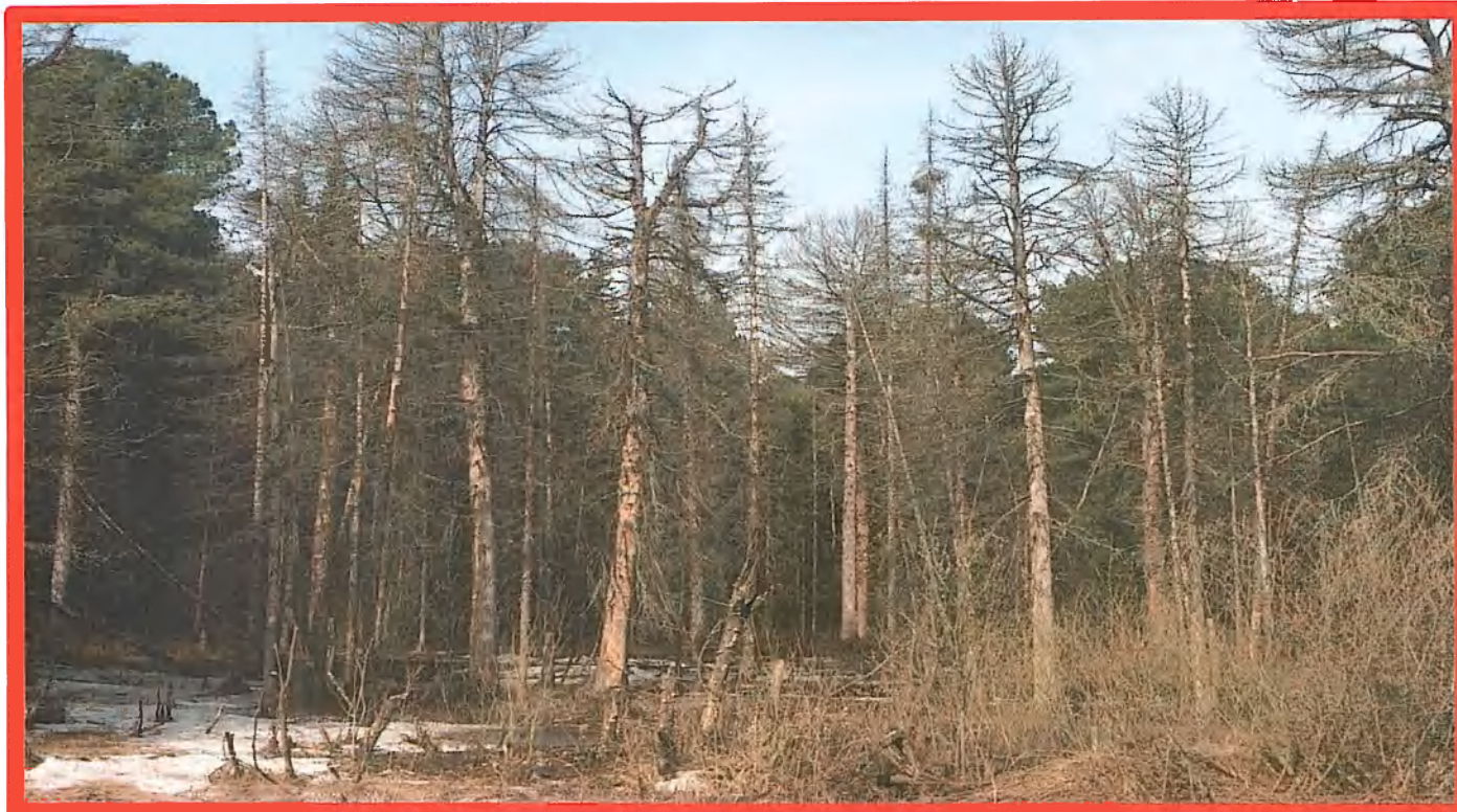
Изображение № 4 Сухостойное дерево. Не является валежником Изображение № 5

Кроме того, необходимо обратить внимание, что деревья, которые лежат на земле, но не имеют признаков естественного отмирания (имеют зеленую листву или хвою), определять как «мертвые» не допускается (смотри изображение № 5).