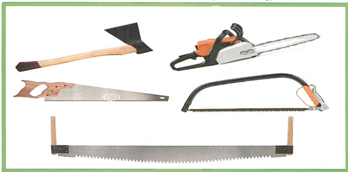
Изображение № 8 Разрешенные инструменты для заготовки

При заготовке валежника допускается применение ручного инструмента (ручных пил, топоров, бензопил) ( смотри изображение 8 ).